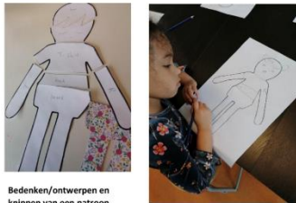
Bedenken/ontwerpen en knippen van een patroon.

elkaar hebben laten zien wat ze ontdekt hebben over Europese landen en is er gekookt en gesmuld van gerechten uit verschillende delen van Europa. Stamgroep 7/8 is nu bezig met het thema Tweede Wereldoorlog.